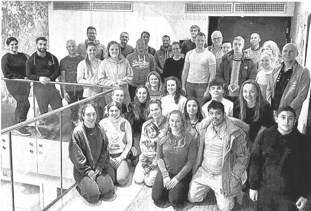
Utviklingsverksted 6.-8. januar 2023 med trenere og ungdommer fra alle landets regioner